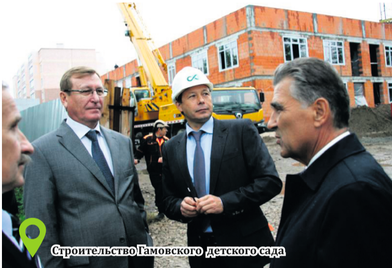
Строительство Гамовского детского сада

В настоящее время Гамово – это современное село, число жителей которого в 2008 году превысило 5000 человек. И это не случайно – с 2005 года в селе идет активное строительство новых домов. А в ближайшие 12 лет количество домов увеличится вдвое.