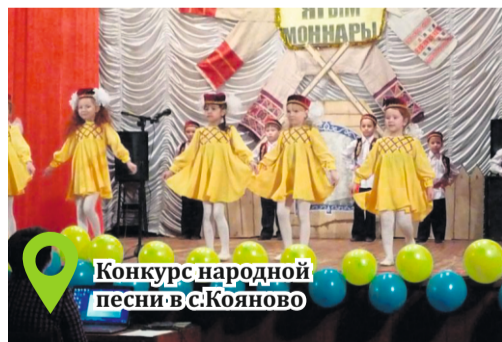
Конкурс народной песни в с.Кояново

В настоящее время в селе насчитываются более 500 хозяйств, проживает 1320 человек. Село многонациональное, однако коренное население – татары – преобладает и составляет 90%. В селе есть основная школа, детский сад, сельский дом культуры, библиотека, сельская врачебная амбулатория, магазины, кафе. В 2012 году на средства выигранного гранта была построена детская площадка в этно-