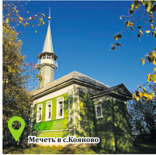
Мечеть в с.Кояново